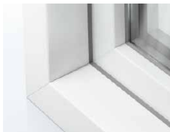
Schüco LivIng Variant in verstek met een omlopende kader contour van 15°