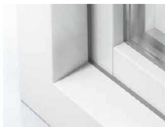
Schüco LivIng Variant HVL met een 15° als onderste kader en 6° als zijkader

Het kunststof systeem Schüco LivIng Variant is een innovatief 6-kamersysteem. Het systeem staat garant voor onovertroffen thermische isolatie en smalle aanzichtbreedtes. Bovendien zorgt de verhoogde constructie diepte voor meer veiligheid, zodat het hangen en sluitwerk ver naar binnen ligt en inbrekers weinig houvast hebben om toe te slaan.