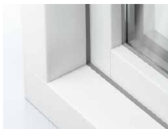
Schüco LivIng Variant HVL met een 15° als kader contour